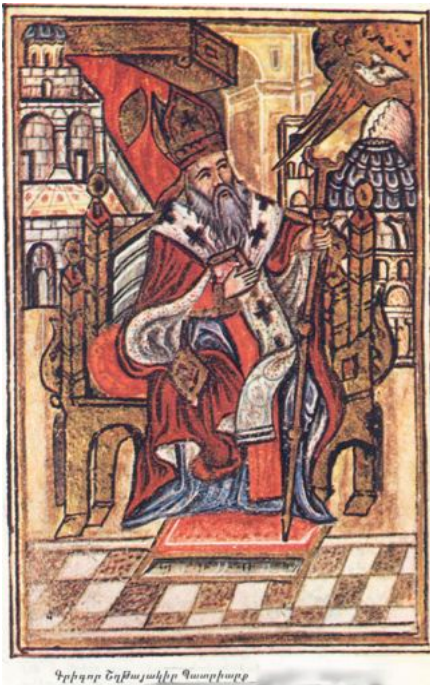
Գրիգոր Շղթայակիր Պատրիարք

Իսկ իր ողջութեանը Երուսաղէմ այցելած Սիմէոն Լեւոսի դպիրը այսպէս կը նկարագրէ Պարոնտէր Պատրիարքին. «Այր մեծ, յաղթանդամ և հսկայածև, սրբասնեալ և եօթնարփի շնորհօք լցեալ...»: