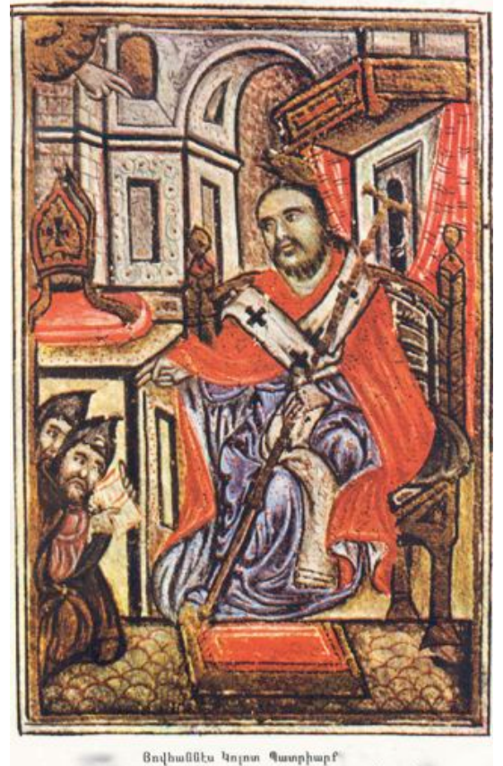
Յովհաննէս Կոլոտ Պատրիարք